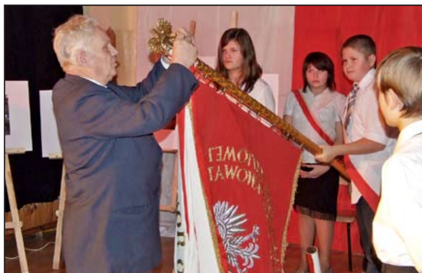
Złoty Medal Opiekuna Miejsc Pamięci Narodowej dla Szkoły Podstawowej w Krężnicy Jarej