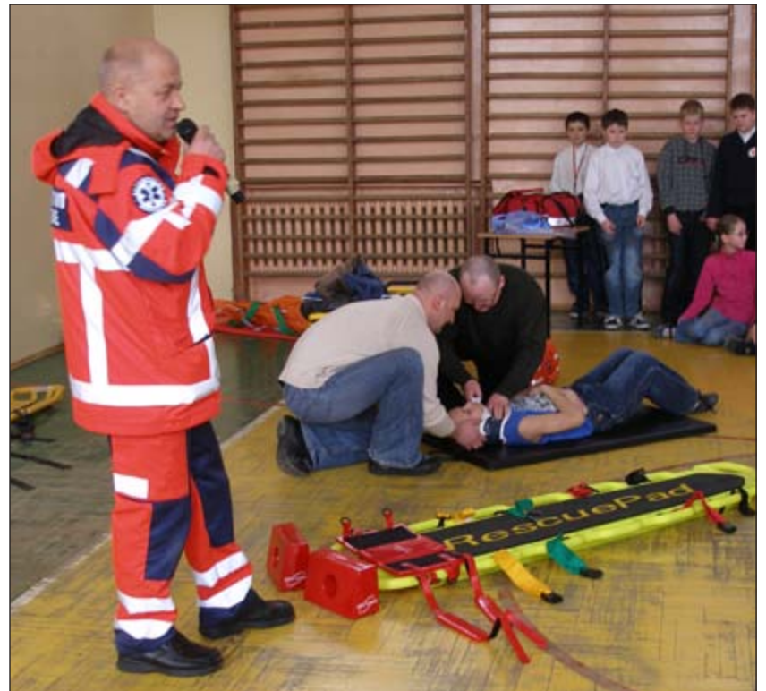
Fot. Pokaz przygotowania rannego do transportu