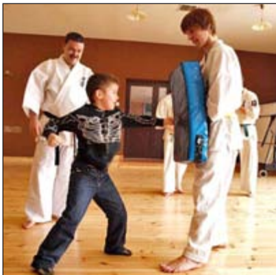
Pokaz karate w GOKSiR.